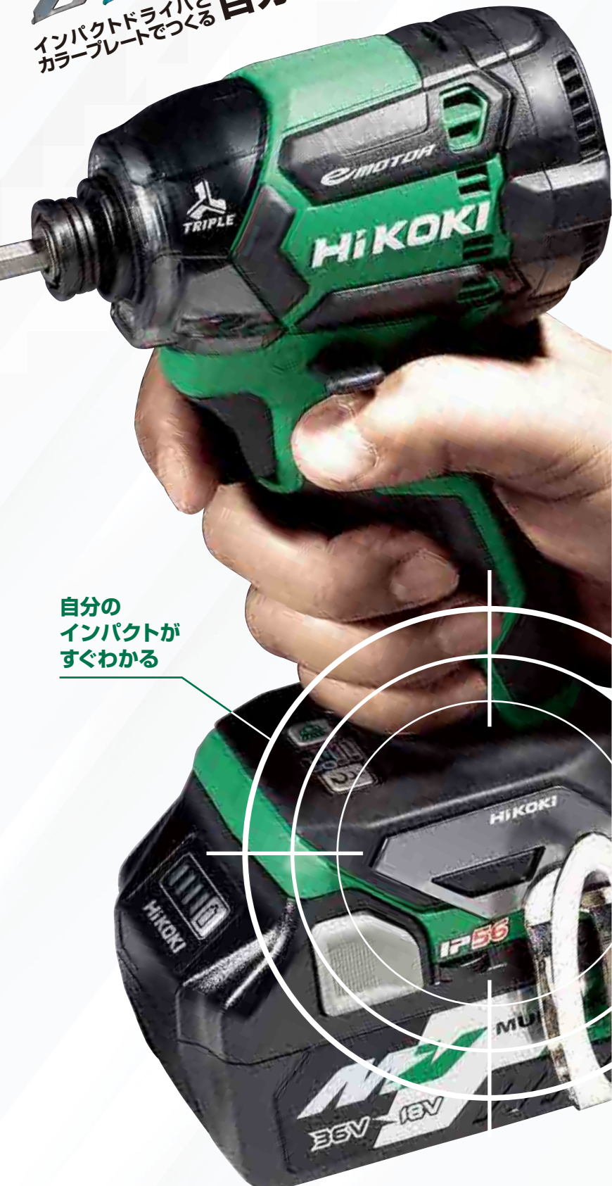
自分のインパクトがすぐわかる

NEW IMPACT DRIVER 5x5 COLORS PATTERNS インパクトドライバとカラープレートで自分好みのカスタマイズ