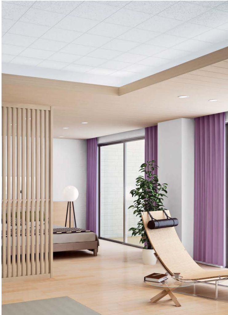
天井材:クリアートン9 (007) TA4007 ¥5,200/梱

不快な生活音や室内の音の響きを和らげます。 広いリビングなどのTV音や話し声を聞きとりやすくしてくれます。